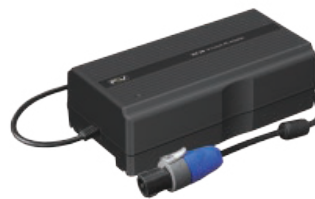
AC adapter with Cable